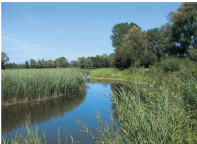
Canale ottobre 2004

prima della loro restituzione al Rio Draganziolo. Il nuovo corso d'acqua presenta un andamento a meandri, diverse quote di fondo e dimensioni tali da garantire i tempi di residenza necessari ai processi di fitodepurazione. La presenza di un nuovo habitat, ad acqua debolmente corrente, ha contribuito all'incremento della biodiversità dell'ambiente di cava.