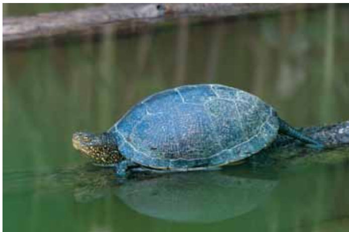
Testuggine palustre

Le tartarughe sono, senza dubbio, i rettili che si possono osservare con più facilità. Negli stagni sono presenti tre tipi di tartarughe: la testuggine palustre ( Emys orbicularis ), la tartaruga dalle guance rosse ( Trachemys scripta elegans ) e la tartaruga dalle guance gialle ( Trachemys scripta scripta ). La prima è una specie autoctona la cui popolazione risulta piuttosto