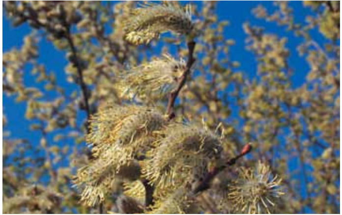
Salice grigio

La vegetazione arborea presente nel territorio delle Cave di Noale è caratterizzata soprattutto da boscaglia di tipo igrofilo prevalentemente a salici, pioppi e ontani. Nelle zone più vicine ai laghi, a ridosso della vegetazione tipicamente palustre, prevalgono gli arbusteti igrofili a salice grigio ( Salix cinerea L.), molto comuni sono anche il salice rosso ( Salix purpurea L.), il salice bianco ( Salix alba L.), il pioppo nero ( Populus nigra L.), il pioppo bianco ( Populus alba L.) e l'ontano nero ( Alnus glutinosa L.).