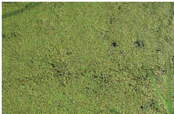
Lenticchia d'acqua

L'Oasi Cave di Noale è composta da una serie di stagni di diversa estensione e profondità variabile da pochi decimetri fino ad un massimo di circa 2 m. La vegetazione è abbastanza diversificata pro-