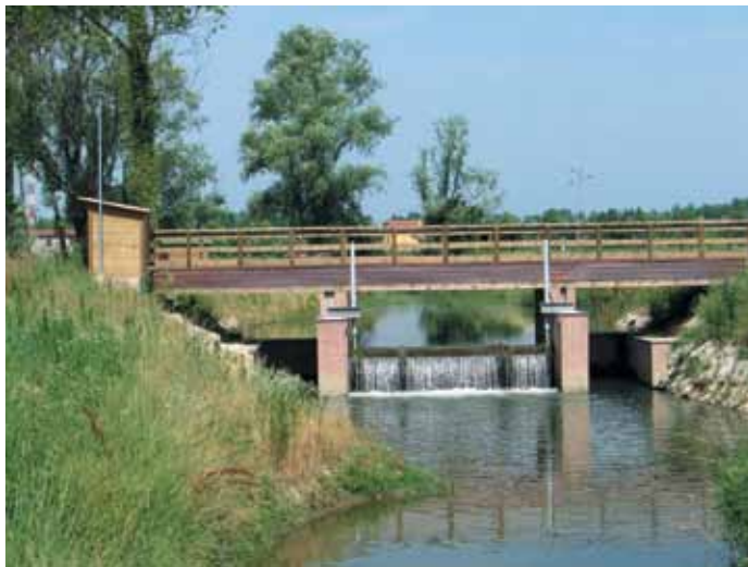
Manufatto di sostegno

Ai margini del canneto è stato realizzato un nuovo corso d'acqua che permette il collegamento dei bacini di cava e la circolazione delle acque