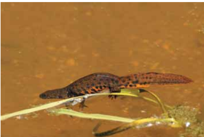
Tritone crestato