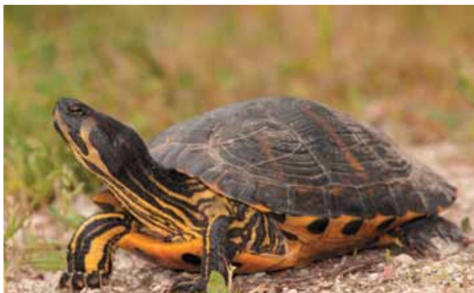
Tartaruga dalle guance gialle