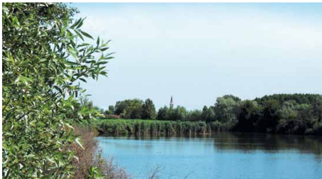
Scorcio del lago principale, sullo sfondo il campanile di Moniego

Un ulteriore rischio per la conservazione dell'area è costituito dal pericolo di interrimento degli stagni e dalla scomparsa del canneto e dei cariceti, a seguito della crescita di specie arboree di tipo igrofilo; essa andrebbe gestita attraverso la pianificazione di interventi di contenimento e il ripristino delle condizioni igrofile preesistenti.