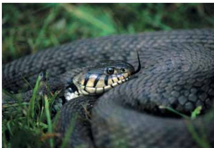
Natrice tessellata

frammentata e discontinua, in quanto strettamente legata a zone umide come quella rappresentata dalle Cave di Noale. Le altre due sono invece alloctone, originarie dell'America, importate e commercializzate in Italia da molti anni. Questi esemplari, se introdotti in qualche area umida, riescono ad adattarsi al nuovo ambiente ed entrano in competizione con le Emys orbicularis (sono entrambe specie onnivore). In questo modo la popolazione di queste ultime tende progressivamente a diminuire, mentre la popolazione di tartarughe americane è in netto aumento. Questa tendenza, comune in tutte le aree umide e i laghetti della pianura padana, si manifesta anche alle Cave di Noale, dove la popolazione di Emys orbicularis , un tempo costituita da un gran numero di esemplari, sembra attualmente essere in una situazione di sofferenza.