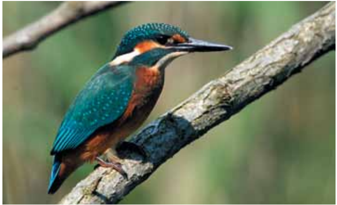
Martin pescatore

Una famiglia di uccelli ben rappresentata in Oasi è quella