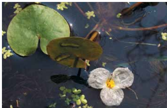
Morso di rana

Al primo tipo appartengono specie che si sviluppano in particolare sulla superficie degli stagni più piccoli e meglio protetti dalla vegetazione arborea ripariale, dove l'acqua risulta meno agitata dal vento: il morso di rana ( Hydrocharis morsus-ranae L.), le lenticchie d'acqua ( Lemna minor L., Spirodela polyrrhiza (L.) Schl.) e l'utricularia ( Utricularia vulgaris L.). Quest'ultima risulta di particolare interesse, in quanto si tratta di una pianta carnivora dai piccoli fiori gialli che si nutre principalmente di dafnie (piccoli crostacei che vivono nelle acque dolci) e larve di zanzara. Deve il suo nome a delle piccole vescicole presenti sulle foglie; quando una preda nu-