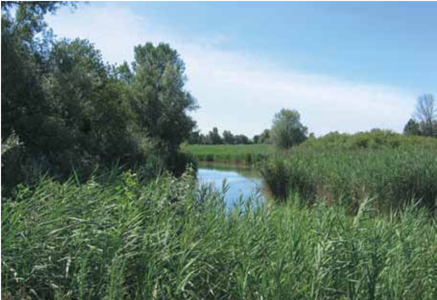
Stagno agosto 2008