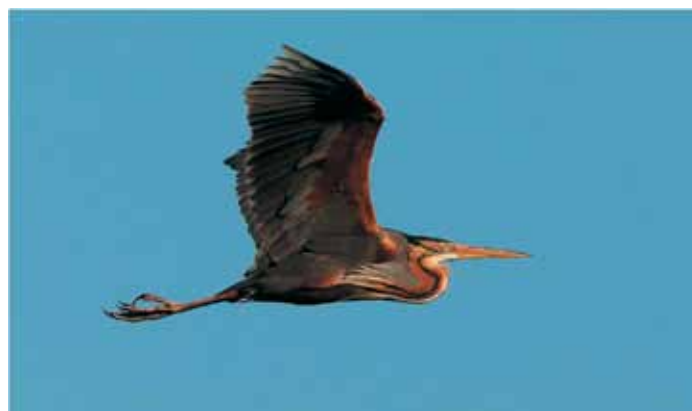
Airone rosso