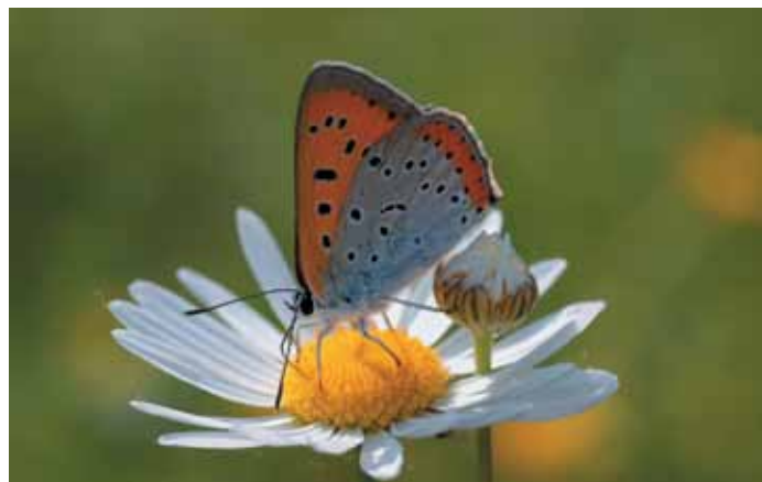
Licena delle paludi

tempo una forte diminuzione a causa della scomparsa o della riduzione del loro habitat, rappresentato da paludi e prati umidi, nei quali trova piante del genere Rumex di cui essa si alimenta.