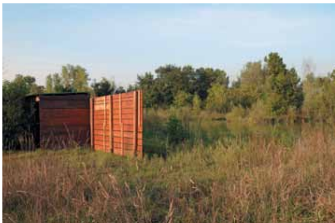
La bassura frequentata dagli uccelli limicoli

Il sentiero che attraversa l'Oasi è stato arricchito di manufatti e strutture utili ai fini di garantire una frequentazione da parte sia di esperti naturalisti che di semplici cittadini: capanni per osservare la fauna senza arrecare di-