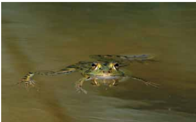
Rana verde

I maschi di entrambe le specie durante il periodo degli amori sviluppano una vistosa cresta sul dorso e sulla schiena. Il primo ( T. vulgaris ) raggiunge la lunghezza mas-