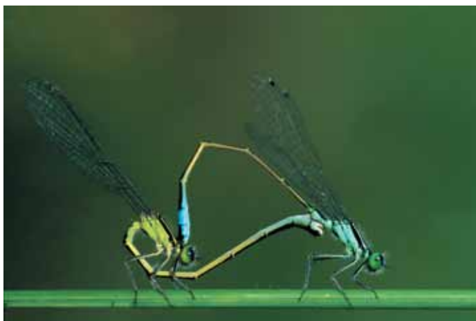
Libellule in accoppiamento

Spesso sulla superficie libera degli stagni è possibile osservare numerosi esemplari di gerridi, insetti che si spostano scivolando ("pattinando") sul pelo dell'acqua. Essi hanno le zampe ricoperte di