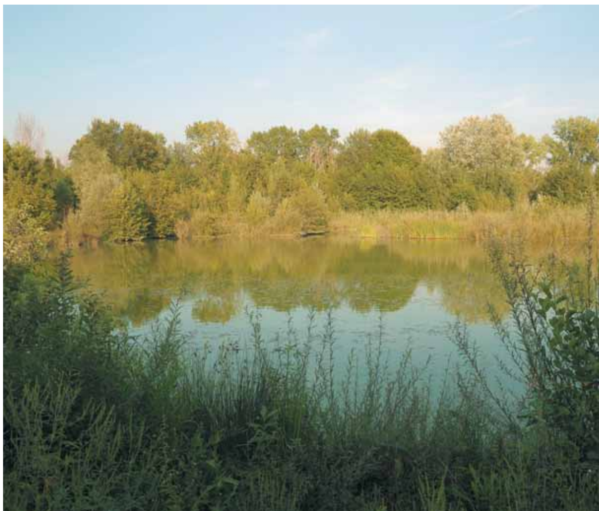
Le Cave di Noale

ASSESSORE ALLE POLITICHE AMBIENTALI PROVINCIA DI VENEZIA