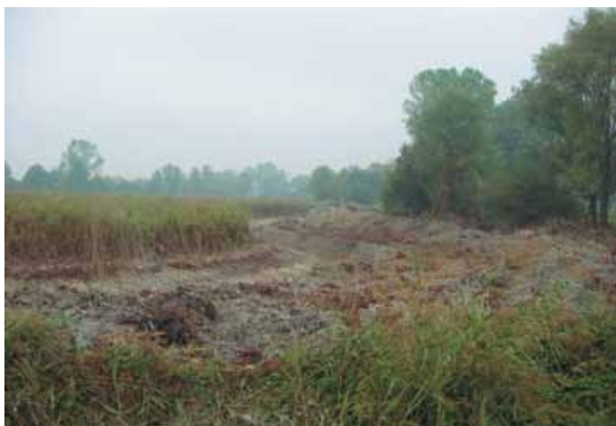
Canale ottobre 2003