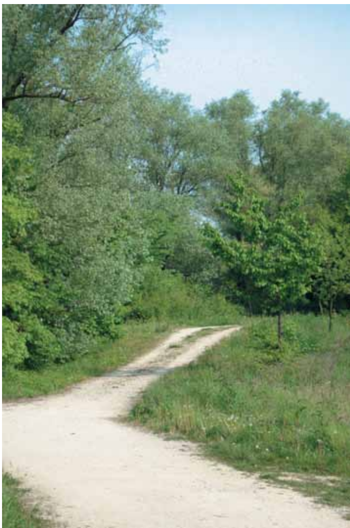
Il sentiero

I percorsi didattici che vengono proposti mirano a sviluppare il senso critico verso le nuove realtà ambientali, promuovendo un rapporto con l'ambiente naturale dove la persona si integra e si relaziona con esso. Le attività proposte permettono ai bambini e ai ragazzi di vivere l'Oasi in maniera personale e sotto molteplici punti di vista, affrontando esperienze nuove ed accattivanti, con l'intento e l'auspicio di stimolare la curiosità e il desiderio di scoperta di un vero e proprio scrigno naturalistico che si nasconde a pochi passi dal centro abitato.