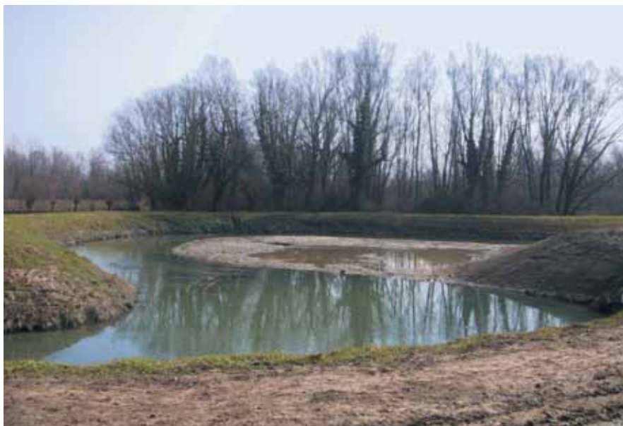
Golena marzo 2004