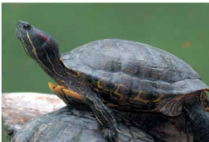
Tartaruga dalle guance rosse