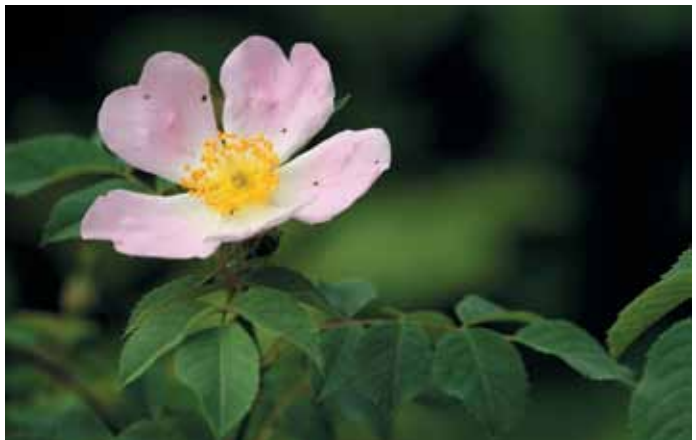
Rosa canina