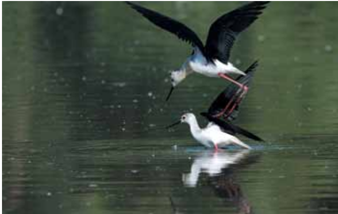
Cavaliere d'Italia

dei fringillidi, a cui appartiene il noto fringuello ( Fringilla coelebs ); è una specie piuttosto socievole e dal comportamento gregario, i fringuelli si muovono per lo più in gruppo e si possono facilmente vedere proprio in piccoli stormi in volo o posati sugli alberi. In Oasi, oltre al fringuello, si possono incontrare cardellini ( Carduelis carduelis ), verdoni ( Carduelis chloris ) e lucherini ( Carduelis spinus ). Sono tutte specie granivore.