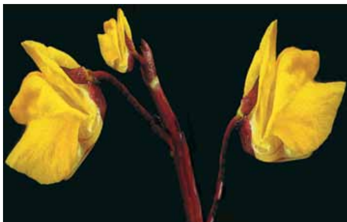
Erba vesicica

ta vicino a queste vescicole si apre l'opercolo che hanno sulla sommità ed essa viene risucchiata, intrappolata e successivamente digerita; fiorisce tra giugno e settembre e compare a profondità comprese tra 10 e 70 cm.