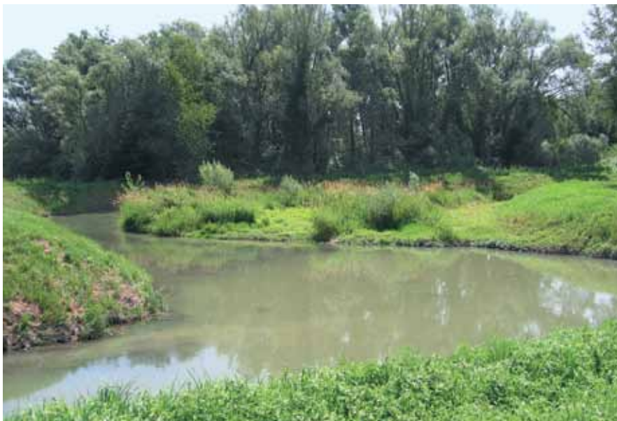
Golena giugno 2007