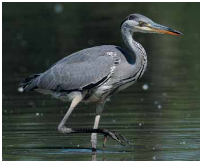
Airone cenerino