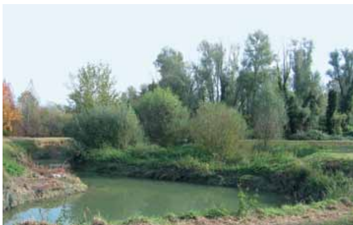
Fiume Draganzuolo

Il Draganzuolo presenta portate talvolta molto diversificate nel corso dell'anno, con forti piene in periodo autunnale e acque anche piuttosto basse durante l'estate. Il fiume attraversa molti centri abitati, quindi presenta condizioni di scarsa naturalità, quali sponde prive di vegetazione, pur mantenendo alcuni caratteri morfologici che gli conferiscono un aspetto naturale e ne denotano la scarsa artifi-