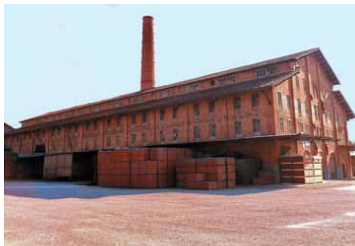
La fornace

Il destino di quest'area, diversamente da quello che accadde in altre aree simili del territorio provinciale veneziano dove le cave furono interrare con rifiuti e trasformate in discariche, fu quello di venire valorizzata per quello che era diventata, ovvero un'area naturale; questo avvenne in particolare sotto la spinta di movimenti cittadini come quello che nacque a Noale verso la fine degli anni '70: il "Comitato per la realizzazione di un'Oasi di Protezione della fauna da localizzarsi nelle Cave di Noale". Vi era dunque da parte di alcuni