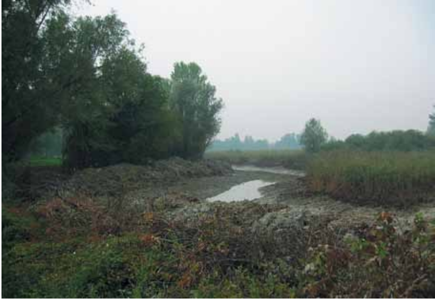
Stagno ottobre 2003