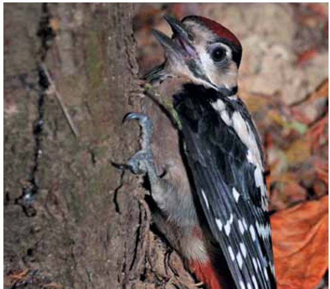
Picchio rosso maggiore

La classe dei mammiferi è rappresentata da alcune specie molto conosciute e tipiche degli ambienti agricoli di pianura, da altre meno