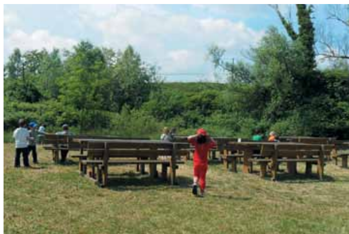
La zona panchine