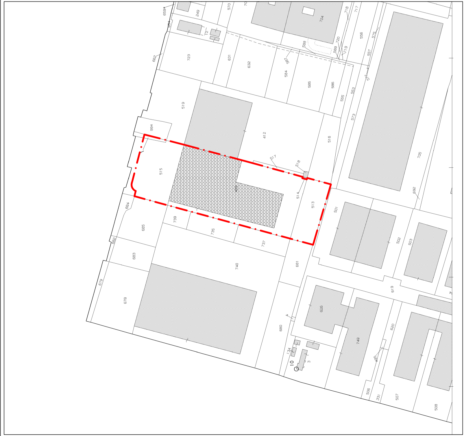
MAPPA CATASTALE SC.1:2000 COMUNE DI MIRANO F.18 mcapp.1-515-409-513-514