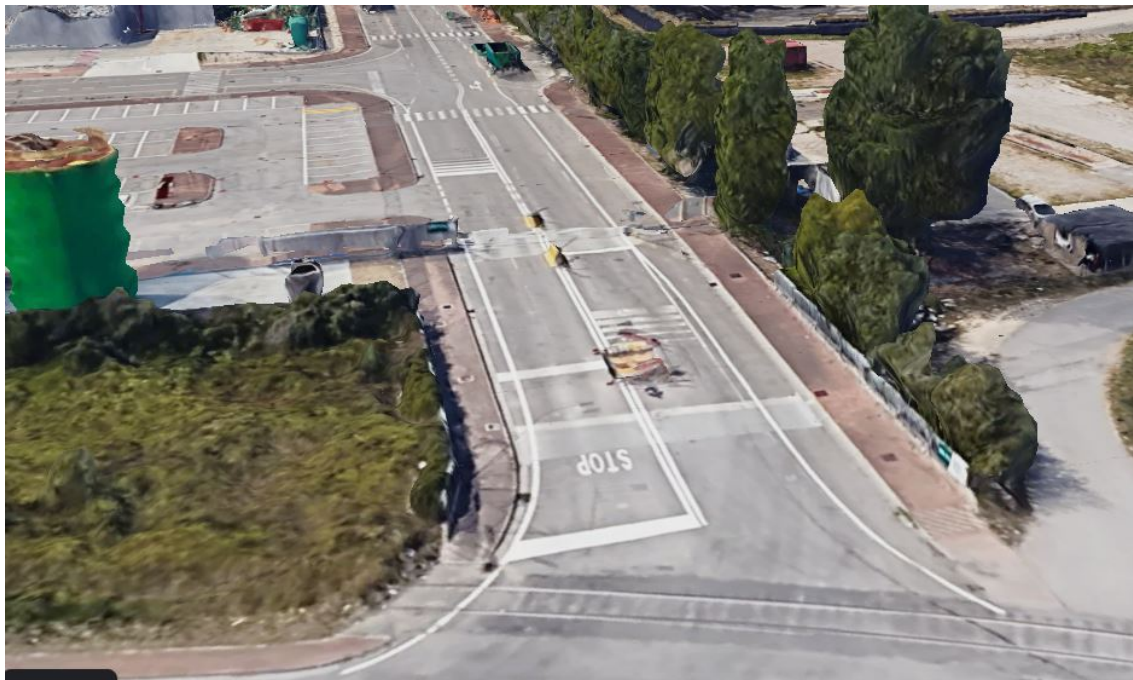
Foto 5. Particolare accesso su via della Geologia – Google Earth.