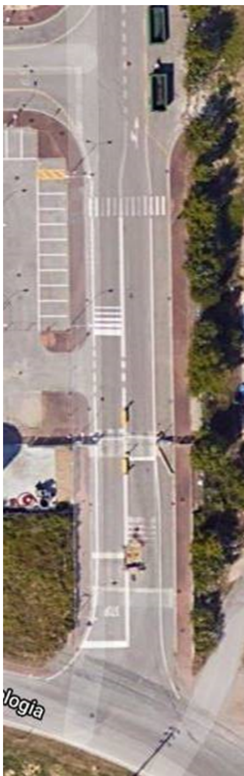
Foto 4. Particolare accesso su via della Geologia – veduta aerea.