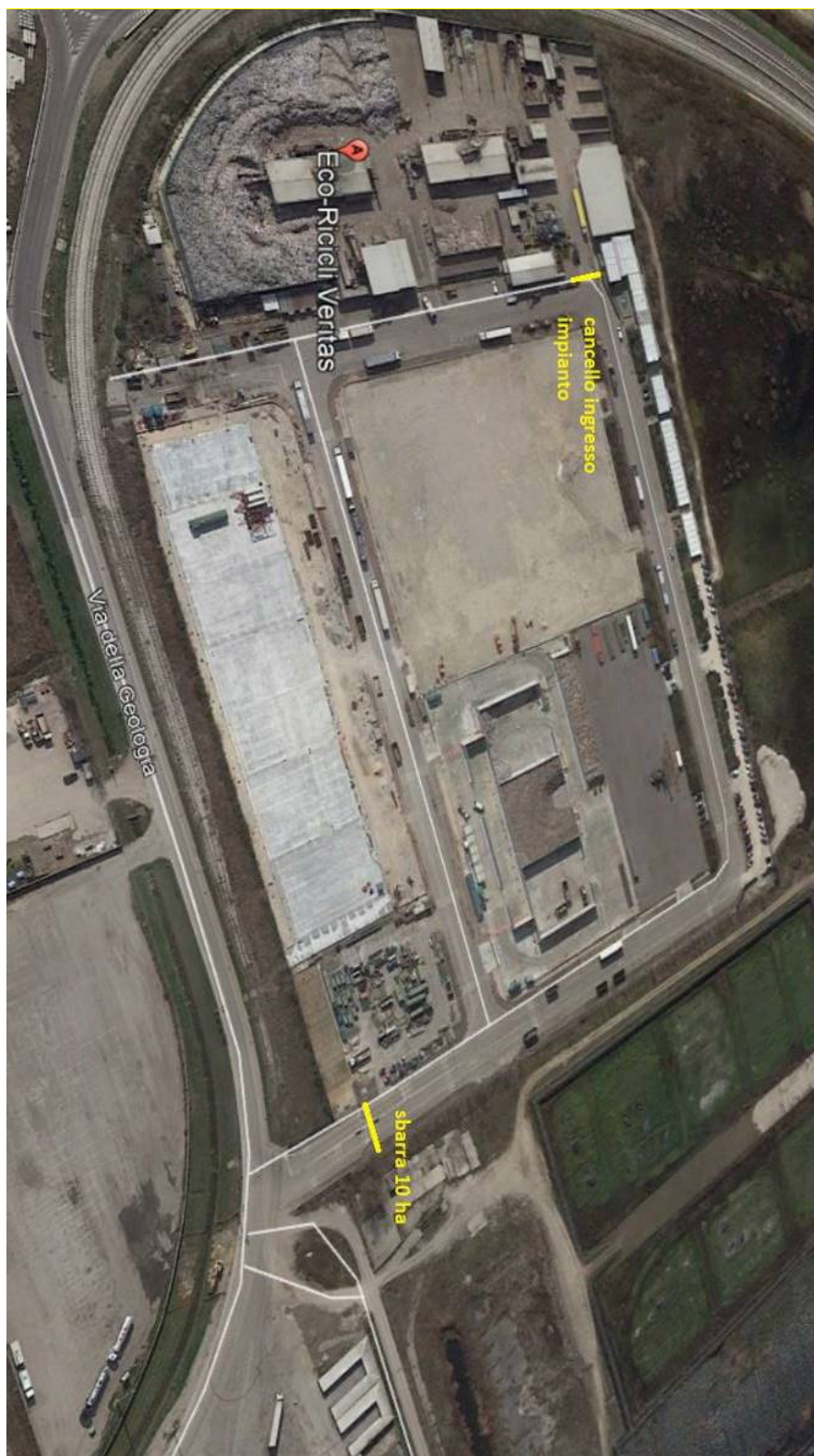
Foto 1. Fotopiano complessivo area 10ha