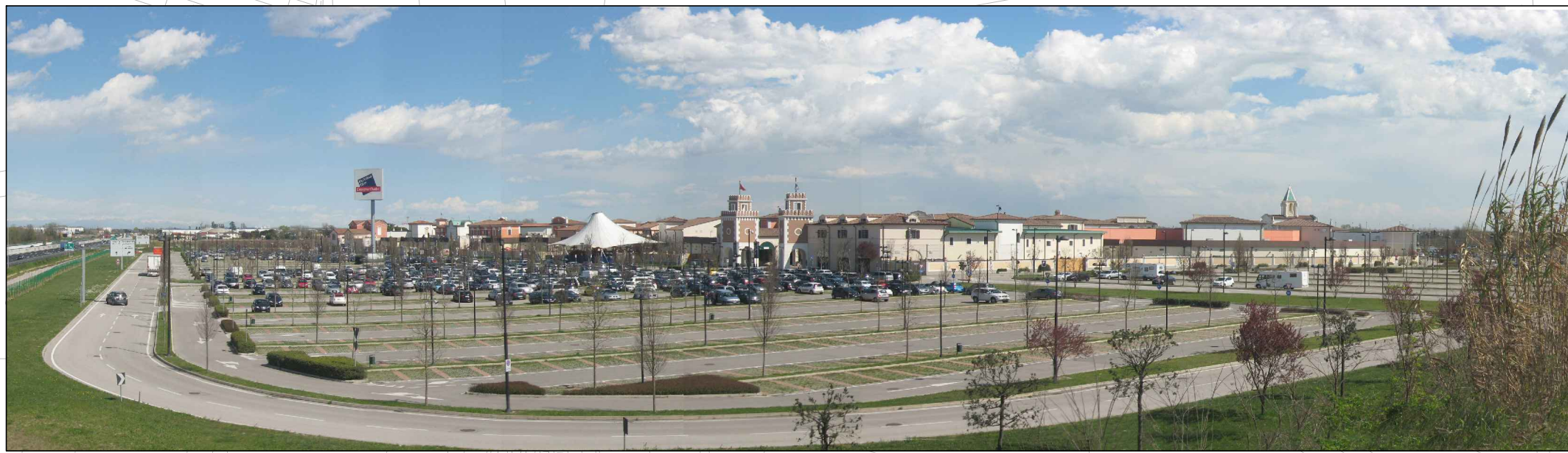
② VISTA DAL CAVALCAVIA "S.P. 55 VIA SANTA MARIA DI CAMPAGNA" – PRIMA