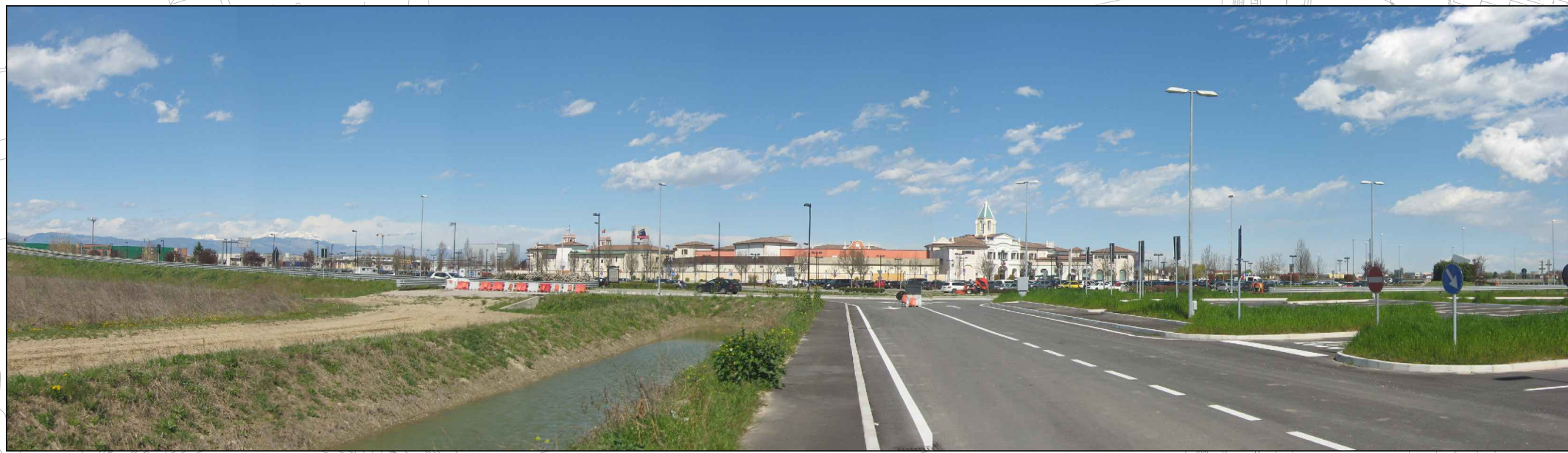
① VISTA DAL CASELLO AUTOSTRADALE – PRIMA