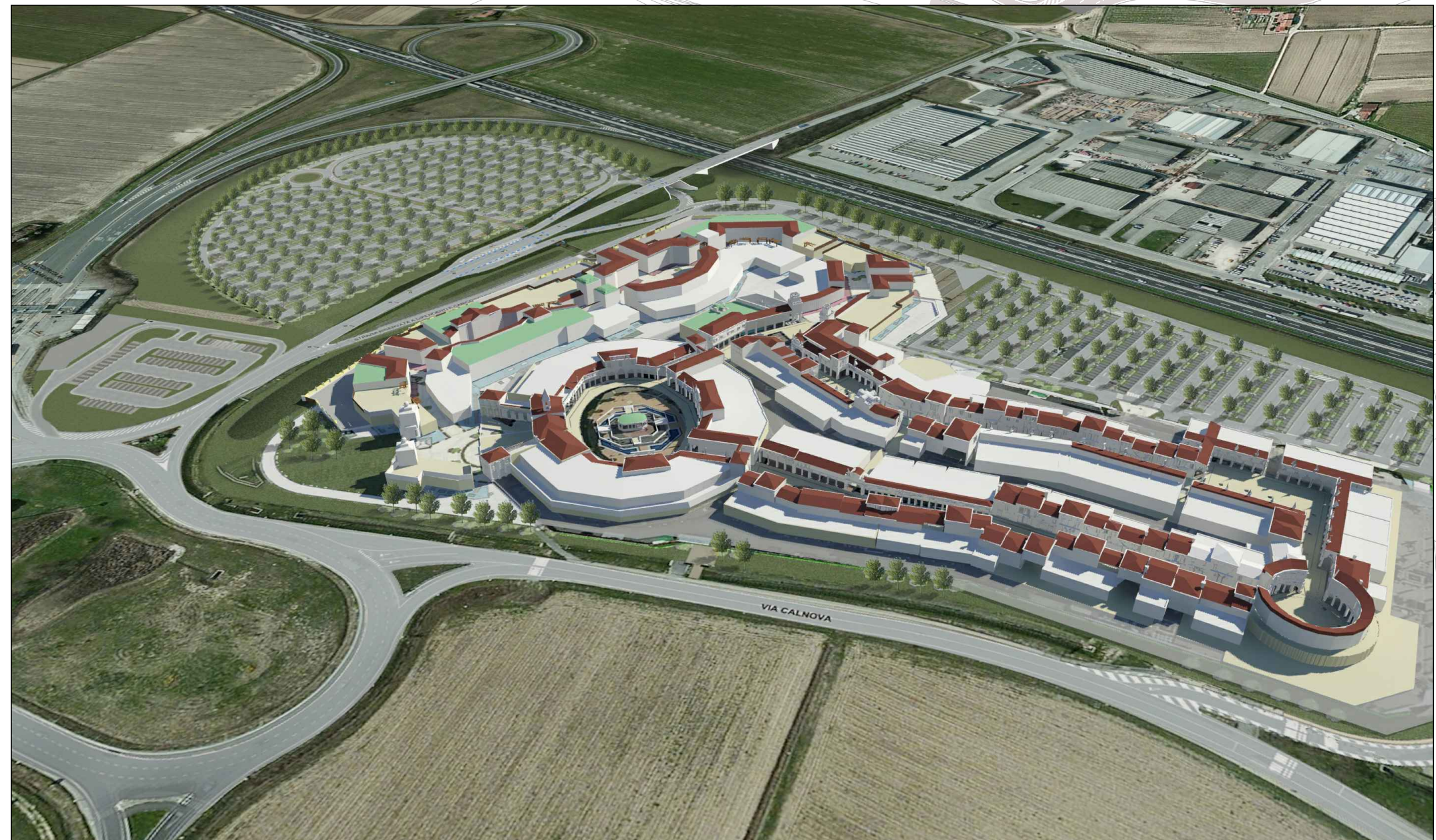
VISTA PROSPETTICA SUD-EST