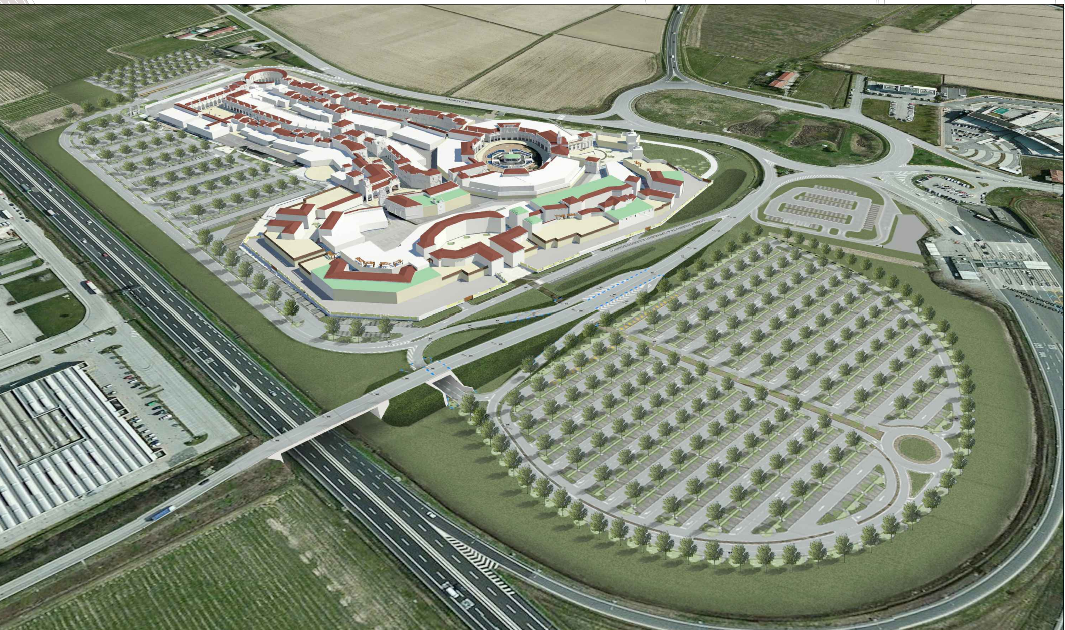
VISTA PROSPETTICA NORD-OVEST