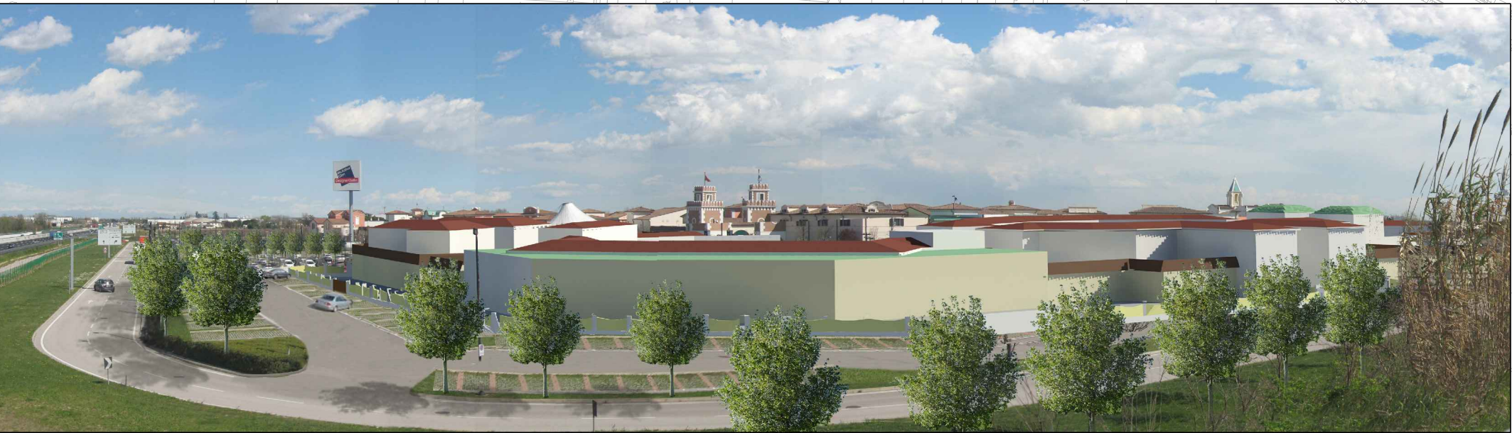
② VISTA DAL CAVALCAVIA "S.P. 55 VIA SANTA MARIA DI CAMPAGNA" – DOPO