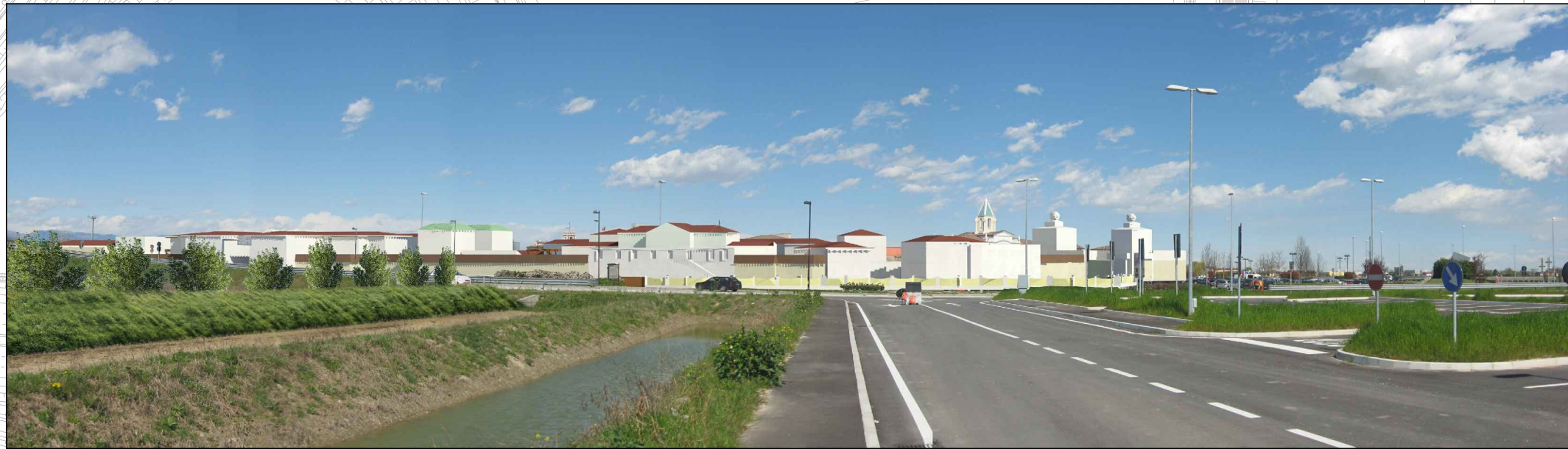
① VISTA DAL CASELLO AUTOSTRADALE – DOPO