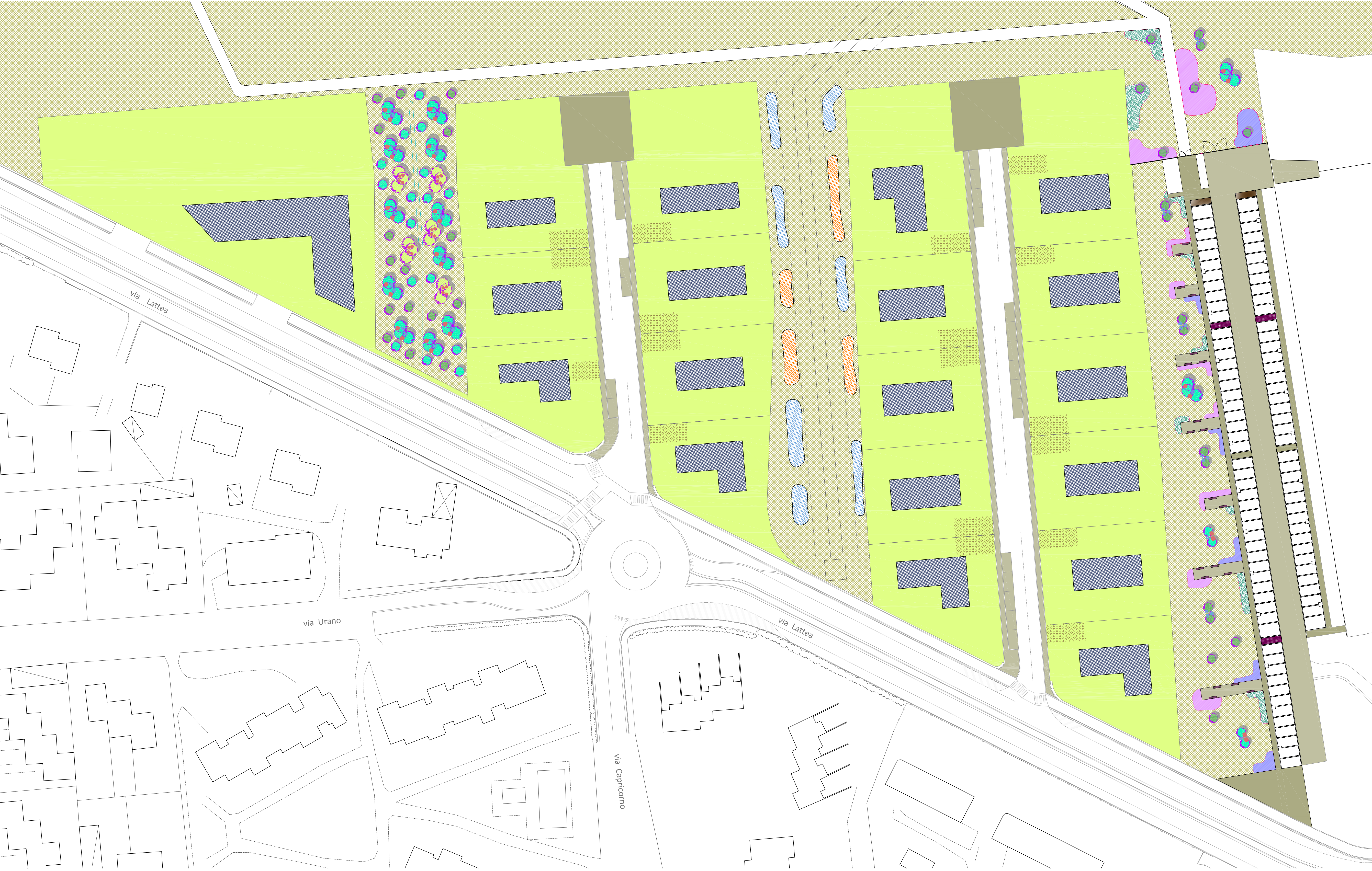
Planimetria - Scala 1:500