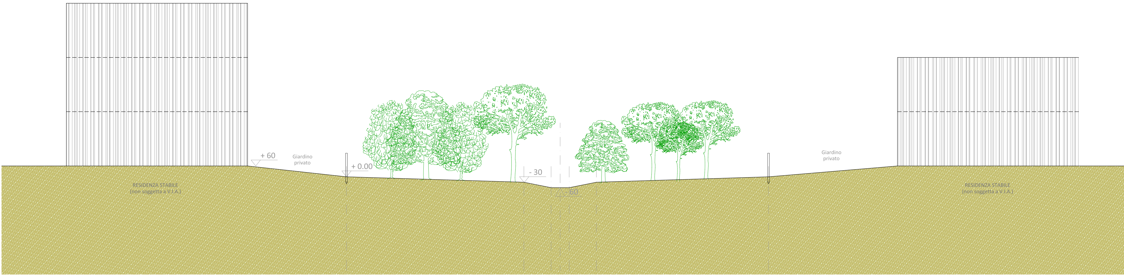
Sezione tipo su 1ª fascia a parco - scala 1:100